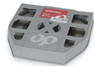
Fleje 5/8" OPHAFLEAI07058