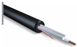
Cable de Fibra Óptica Mini ADSS OPCFOCE09MSA12FR3B