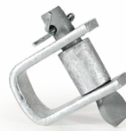
Herraje D OPHAHEDAC